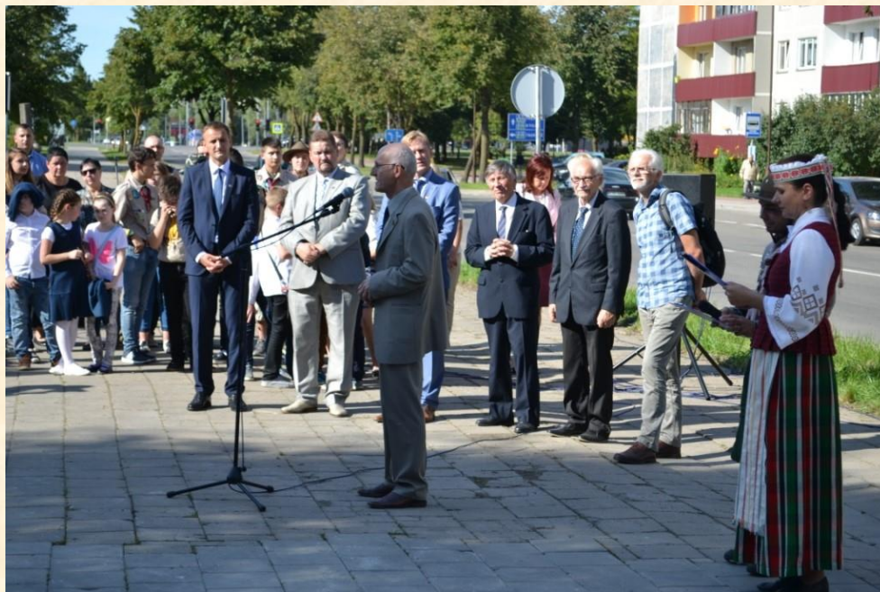
Lieporių parke atidaroma Signatarų alėja.