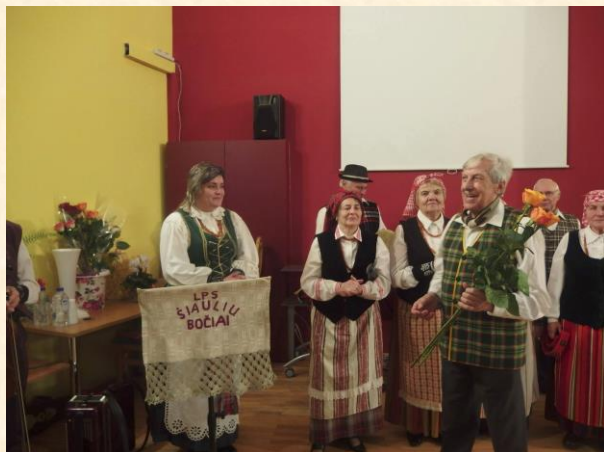
Šiaulių „Bočiai“ spinduliuoja jaunatviška energija.