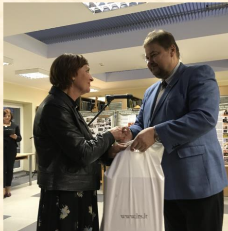
Visada malonu pasveikinti knygos kultūros skleidėjus.

2017 m. lapkričio 30 d. – Šiaulių miesto savivaldybės viešosios bibliotekos 40-mečio minėjime. Pasveikinau Šiaulių miesto savivaldybės viešosios bibliotekos vadovus, darbuotojus, visų septynių mieste veikiančių filialų darbuotojus, skaitytojus su bibliotekos 40-mečiu. Sakiau, kad biblioteka – inovatyvi, aktyvi, ieškanti, besikeičianti, atvira, kurianti, einanti vienu žingsniu su skaitytojais. Šią žodžių-pagyrimų pynę sukūriau ne aš, o skaitytojai, aplinkinių bendruomenių žmonės, bibliotekos lankytojai. Bibliotekos pagrindinis gyvenimiškas akcentas – BENDRUOMENIŲ BIBLIOTEKA – kultūros, šviesos, mokslo, grožinės literatūros židyns.