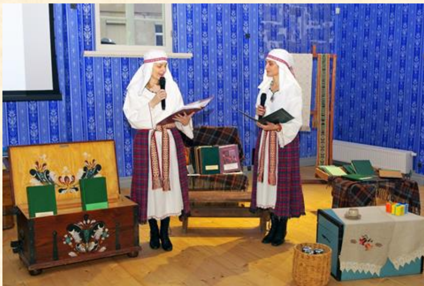
Renginio vedėjos atskleidė bibliotekos turtus.