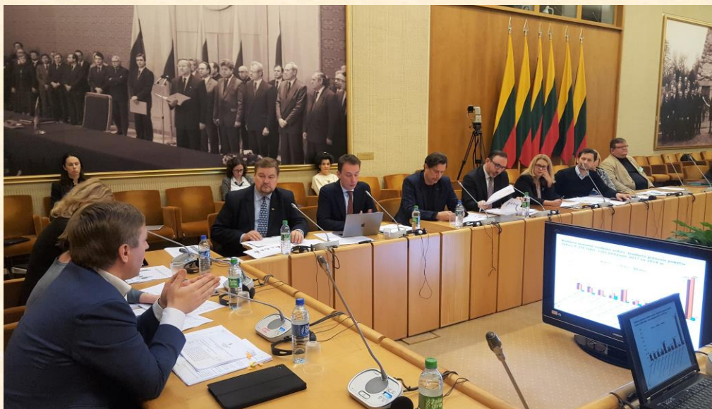
Diskutuojuame Kultūros komiteto posėdyje.

Atitinkamai sumažinti Finansų ministerijai valstybės skolos aptarnavimui skiriamus asignavimus.