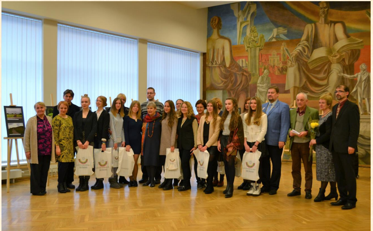
Fotografijų konkurso laureatai, dalyviai, parodos svečiai.