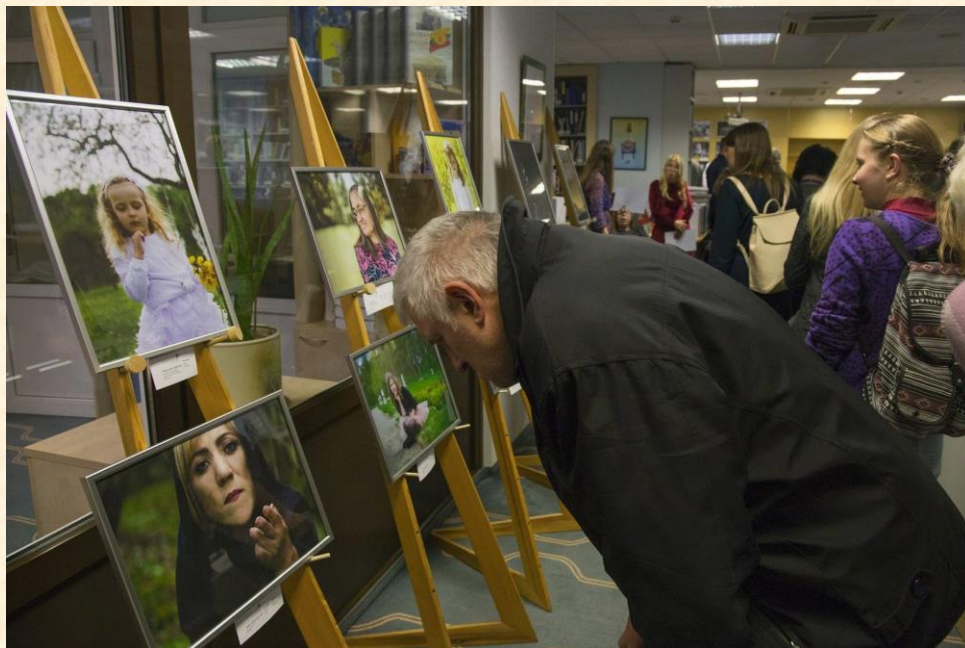
Fotografijų parodoje atsiskleidė tikrasis žmogaus grožis.