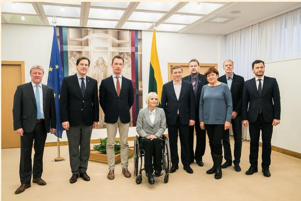
Susitikime su kolegomis iš Čekijos Respublikos Senato.