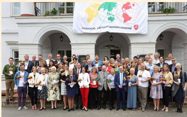
Suvažiavimo dalyviai ir svečiai.

2017 m. liepos 3 d. dalyvavau Pasaulio Lietuvių Bendruomenės (toliau – PLB)