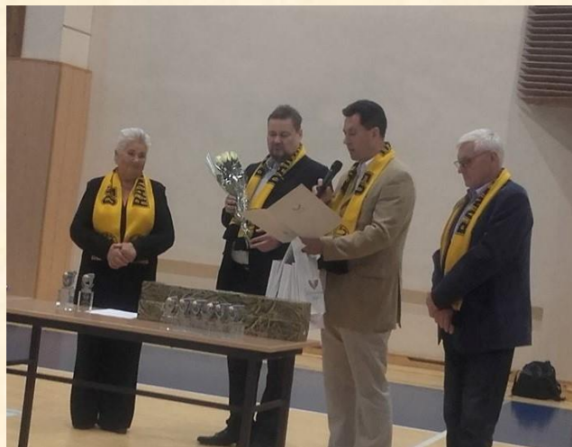
Sveikinu Šiaulių rankiniui nusipelnčius žmones.