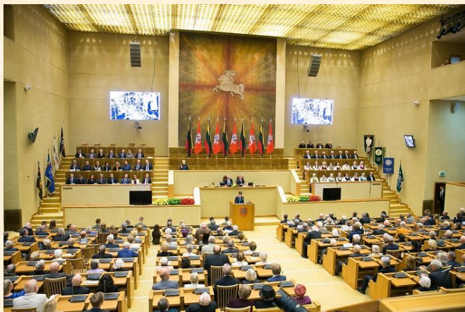
Gedulo ir vilties bei Okupacijos ir genocido dienų minėjimas Seime.

Pranckietis minėjime pagrįstai teigė: „Įsivaizduokite, net pusę amžiaus mums buvo draudžiama apie tai žinoti, kalbėti... Okupantai norėjo mus paversti kurčiais ir aklais, negirdinčiais savo tautos aimanų ir troškimo būti laisviems... Mes, artimieji, netekę savo brangių žmonių, juos vis dar girdime dainuojančius, matome išdidžius, besišypsančius nuotraukose iš Sibiro (kad artimieji Lietuvoje, gink Dieve, neliūdėtų), darbščius ir mokačius mus beatodairiškai mylėti artimą savo, gimtinę vienatinę. Dabar ir visados.“. Minėjime prasmingas kalbas tautai sakė ir Kaišiadorių