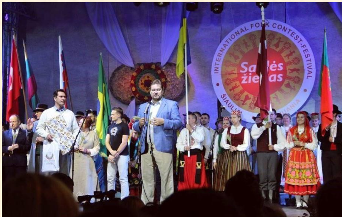
Sveikinu Tarptautinio folkloro konkurso-festivalio „Saulės žiedas“ laimėtojus.