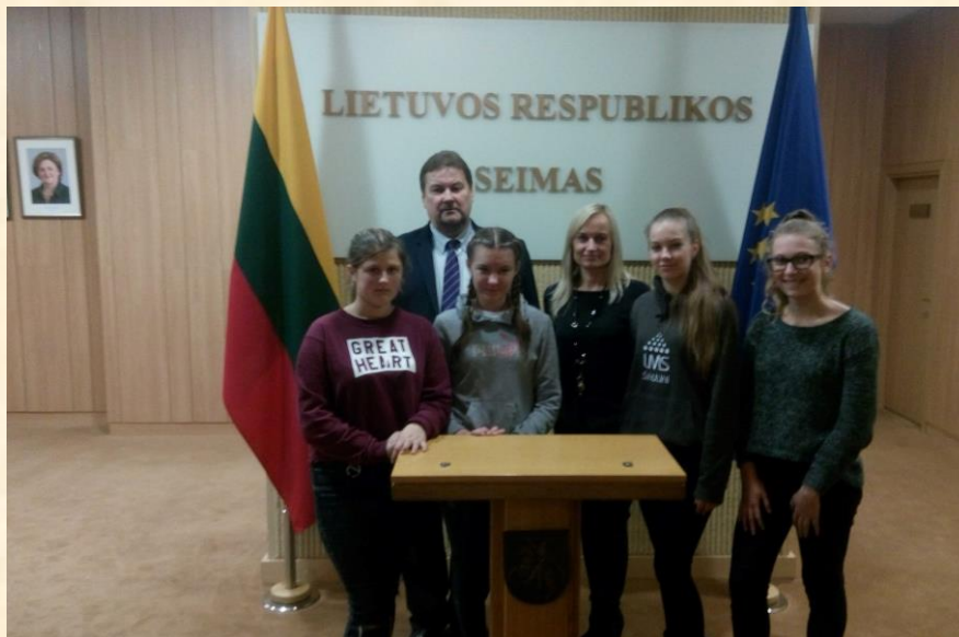
Seime su jaunaisiais pasieniečių būrelio nariais.

2017 m. gruodžio 13 d. dalyvavau Kultūros komiteto posėdyje, kuriame svarstėme Lietuvos Respublikos Trišalės tarybos kultūros komiteto kreipimąsi, Seimo nutarimo „Dėl Evelinos Karalevičienės paskyrimo Valstybinės kultūros paveldo komisijos pirmininke“ projektą, Visuomenės informavimo įstatymo Nr. I-1418 17, 19, 22, 24, 34 1 , 49, 50 ir 52 straipsnių pakeitimo įstatymo projektą, Visuomenės informavimo įstatymo Nr. I-1418 47 straipsnio pakeitimo įstatymo projektą, Lukiškių aikštės Vilniuje įstatymo projektą, Lietuvos policijos kapeliono Algirdo Toliato kreipimąsi. Reaguodamas į aktualijas, atkreipčiau Jūsų dėmesį į Lietuvos Respublikos Lukiškių aikštės Vilniuje įstatymo projektą, kurį teikia 41 Seimo narys, įskaitant ir mane.