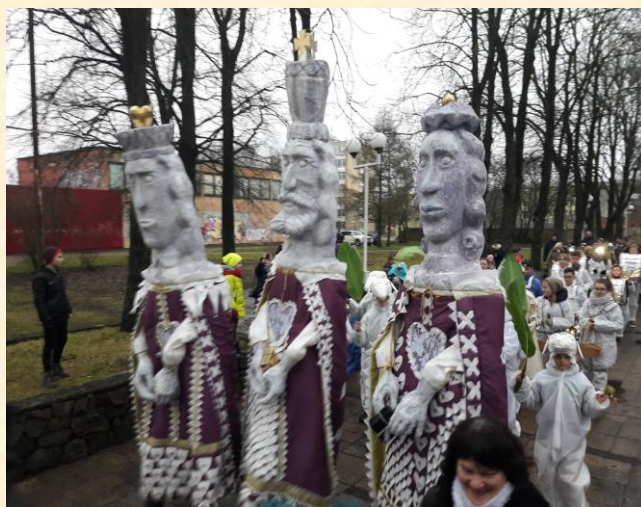
Trijų karalių šventėje netrūko džiugesio ir sakralios vilties.