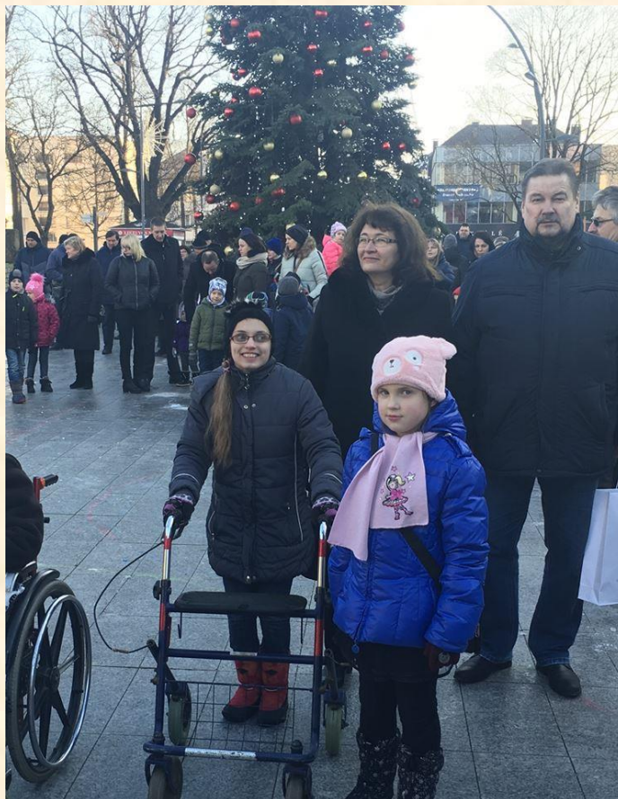
Prasminga akcija suvienijo mus visus.

sunku, kuriems Gyvenimas davė išbandymų. Kartu mes galime daug, bus lengviau, kai galėsime vienu balsu pasakyti – TAI MES.