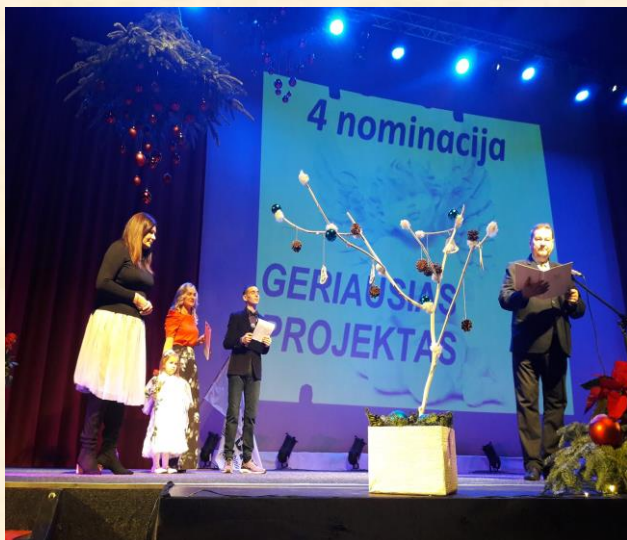
Geriams ir geriausiems įteikiau padėkas.