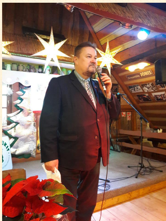
Sveikinu ilgamečius savo bičiulius žemaičius. Dešinėje – 2019 m. žemaičių kalendorius.