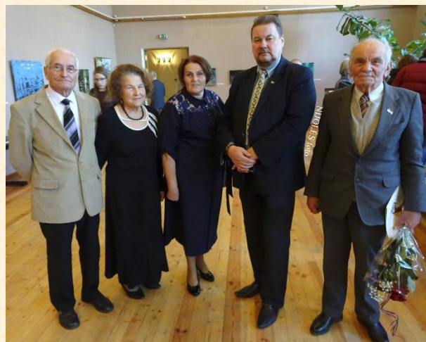
Patriotinė šventė suvienijo liudininkus ir jaunąją kartą.