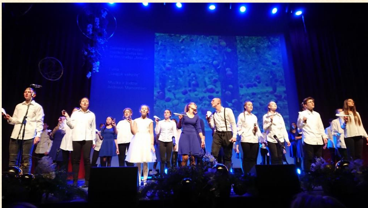
Stasio Šalkauskio gimnazijos mokiniai parodė pagarbą mokyklai ir Lietuvos istorijai.