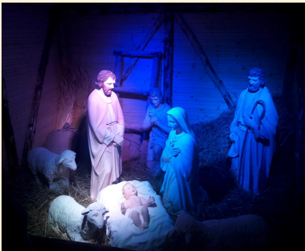
Prakartėlė mums priminė tikrąją šv. Kalėdų prasmę.