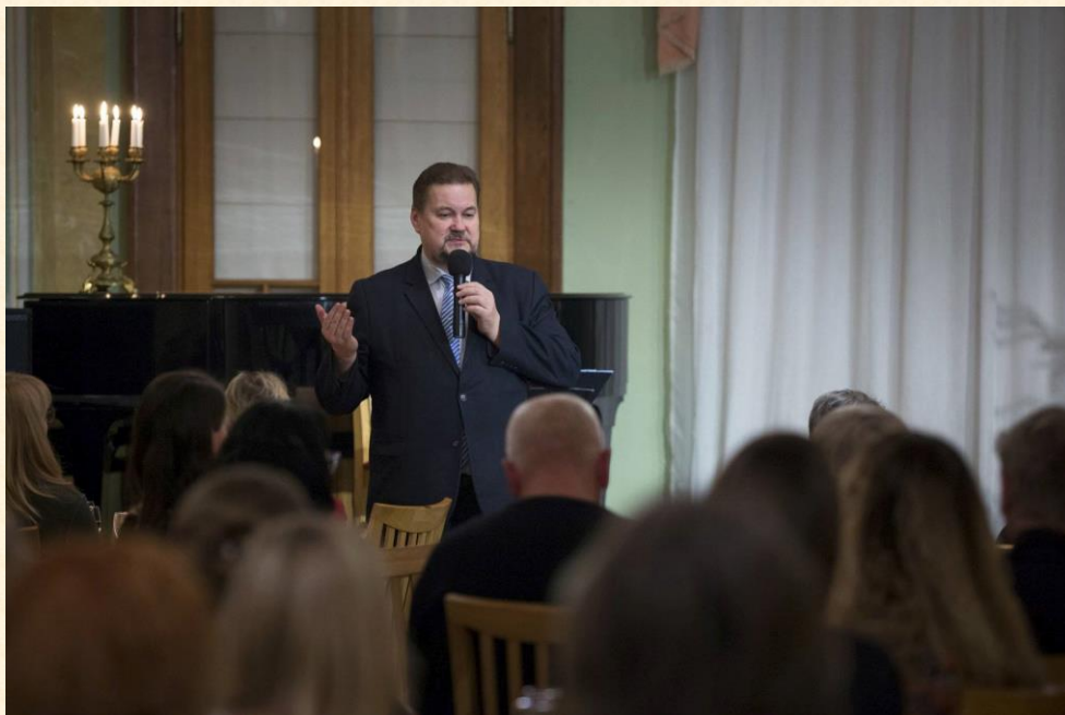
Sveikinu Šiaulių „Aušros“ muziejaus darbuotojus.