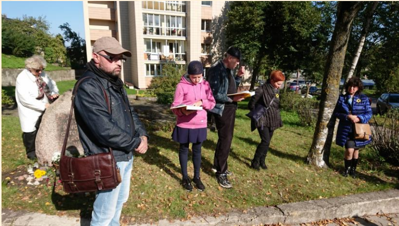
Holokausto aukų VARDŲ skaitymas Šiauliuose.