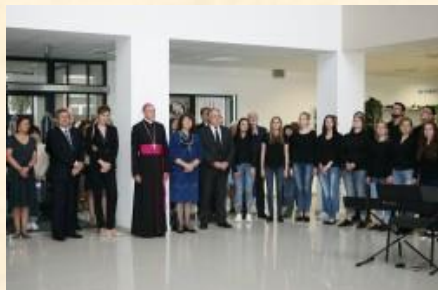
Mokslo ir žinių diena 20-metį švenčiančiame Šiaulių universitete.