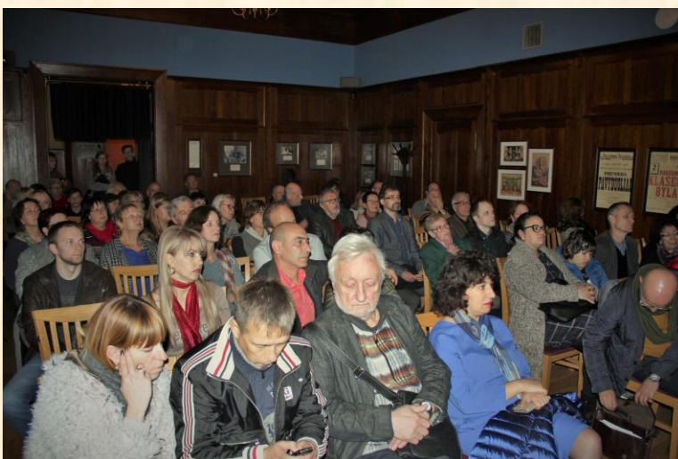
Dokumentinio filmo „Paskutinis rugpjūčio sekmadienis“ pristatymas.