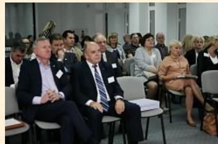
Regionui svarbioje ekonomikos ir verslo konferencijoje.

2017 m. rugsėjo 8 d. – VI mokslinėje-praktinėje konferencijoje „Ekonomika ir verslas: regiono problemos ir galimybės 2017“, kurią organizavo Šiaulių universiteto Ekonomikos katedra. Buvo perskaityti aktualūs pranešimai („Švietimo ir verslo bendradarbiavimas – situacija ir galimybės“, „Pirmųjų metų iššūkiai versle“, „Regioninės politikos įgyvendinimo priemonės. Kodėl jos neduoda laukiamo rezultato“, „Trijų Lietuvos regionų modelis: socioekonominė situacija ir pagrindimas“), vyko Apskritojo stalo diskusija apie Lietuvos savivaldybių fiskalinį konkurencingumą. Konkurencija parodė ne tik Šiaulių universiteto mokslininkų įdirbį, būtinybę kuo skubiau priimti Šiaurės Lietuvos regionui reikalingus sprendimus.