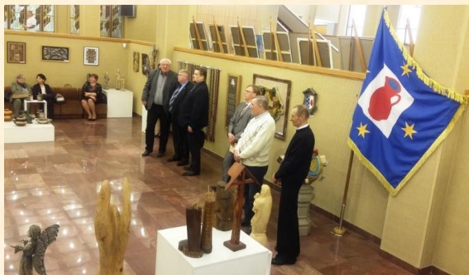
Kuršėnų tautodailininkų parodos Seime atidarymas.

Archyvinuose dokumentuose užfiksuota, kad Kuršėnų valsčiaus savivaldybė pradėjo kurtis 1918 m. vasario pabaigoje. Tų pačių metų lapkričio 30 d. įvyko pirmasis pildomojo (vykdomojo) komiteto posėdis. Ir Lietuvos valstybė, ir Kuršėnai (Kuršėnų savivalda) 2018 metais švęs savo įkūrimo šimtmečio datas. Šia proga ir surengta paroda, skirta Kuršėnų miestui. Šventėje buvo prisiminta Kuršėnų miesto – puodžių sostinės – istorija, pristatyti net 25 tautodailininkų darbai (keramika, tapyba, medžio drožiniai, karpiniai, floristika), įteiktos Seimo padėkos. Susirinkusius dainomis sveikino Kuršėnų meno mokyklos vokalinis kvartetas, Meškuičių instrumentinė grupė.