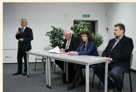
Seimo Pirmininkas diskutuoja su piliečiais.

pirmininkas audringame susitikime atsakė į žmonių klausimus, replikas, argumentuodamas valstybės interesais ir asmenine patirtimi. „Aš žinau, kad esu kaltas už visas bėdas Lietuvoje“, – ironiškai pastebėjo vienas valstybės vadovų. Tačiau jis kvietė žmones pačius priimti atsakomybę už savo likimą, nebijoti keisti kvalifikacijos, suvokti reformų būtinybę, teikti pasiūlymus. „Mes turime paprasčiausią užduotį – įgyvendinti žmonėms duotus pažadus“, – atsakingai apibendrino Seimo Pirmininkas.