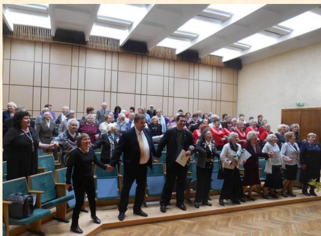
Šiaulių artritito draugijos šventėje.