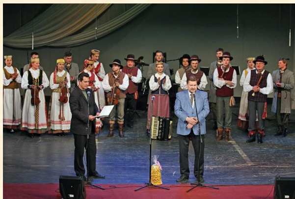
Sveikinu profesionalųjį „Saulės“ kolektyvą.

2017 m. gegužės 13 d. dalyvavau Šiaulių universiteto liaudiškos muzikos ansamblio „Saulė“ šventėje, skirtoje ansamblio kūrybinės veiklos 45-mečiui pažymėti Valstybiniame Šiaulių dramos teatre. Šventėje buvo daug svečių, sveikinimų, bet svarbiausia, kad „Saulė“ yra vienas didžiausių Šiaulių universiteto ir miesto turtų. Sveikinimo kalboje minėjau, kad šis ansamblis jau daug metų yra Šiaulių universiteto ambasadorius, ne kartą apkeliaavęs ir koncertavęs JAV, Pietų Amerikoje, Kinijoje, aplankęs didžiąją dalį Europos. Įteikiau Seimo padėkos raštus ilgiausiai kolektyve dirbantiems vadovams, muzikantams, solistams.