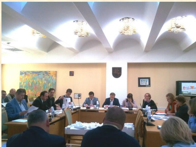
Kultūros komitete vyksta konceptualios diskusijos.

2017 m. gegužės 24 d. dalyvavau Kultūros komiteto posėdyje. Jame nagrinėjome Misionierių vienuolyno statinių ansamblio teritorijoje vykdomą veiklą, Vakarų Lietuvos kultūros padėtį ir perspektyvas, Visuomenės informavimo įstatymo Nr. I-1418 2, 31, 33, 341, 47, 48 straipsnių pakeitimo įstatymo projektą, Lietuvos nacionalinio radijo ir televizijos įstatymo Nr. I-1571 6 ir 10