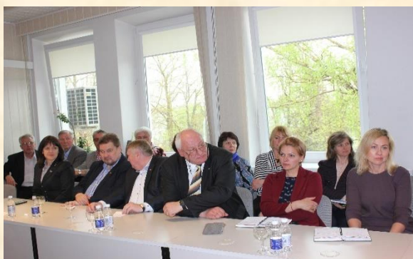
Visuomenės susitikime su Seimo Pirmininku.

2017 m. gegužės 15 d. vizitą surengė Seimo pirmininkas prof. Viktoras Pranckietis. Jis atvyko su savo pirmąja pavaduotoja Rima Baškiene. Kartu su kolegomis dalyvavau susitikime su Šiaulių regiono verslo atstovais. Seimo Pirmininko aktyviai klausta apie regioninę politiką, verslo sąlygas, atliekų išvežimo mokesčius, priimamų įstatymų kokybę, aukštojo mokslo reformą ir kt. Klausimų gausa liudija realias žmonių problemas, kurias supranta ir V. Pranckietis. Norėdamas jas išgirsti Seimo Pirmininkas itin aktyviai važinėja po Lietuvą, bendrauja su žmonėmis ir siūlo jiems patiems teikti pasiūlymus ir pataisas. Lietuvos valstiečių ir žaliųjų sąjunga siekia išspręsti esmines Lietuvos problemas, dėl to tiesioginė komunikacija su piliečiais yra būtina ir, beje, vaisinga.